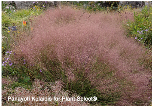
Panayoti Kelaidis for Plant Select®